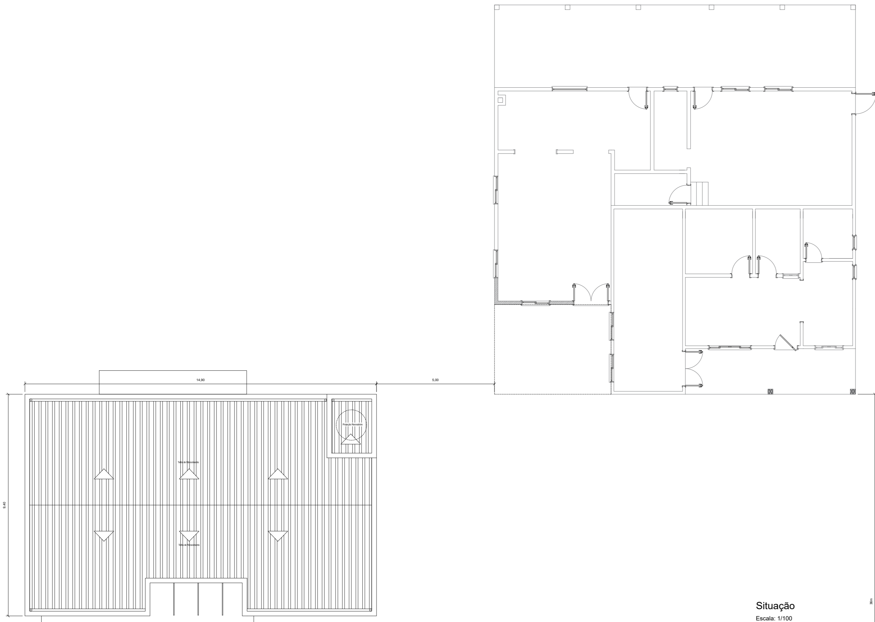
Situação Escala: 1/100